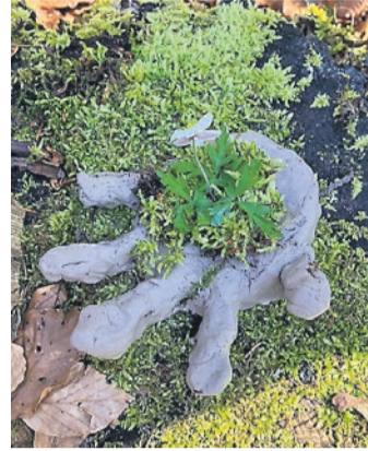
Gottes Hand ist nicht leer.

Anfangs März haben die KUW-Schüler/Innen der Berner Dörfer aus der 3. bis 6. Klasse diese Naturwerke zum Psalm 8 gestaltet.