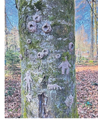
Die Augen Gottes sind überall.