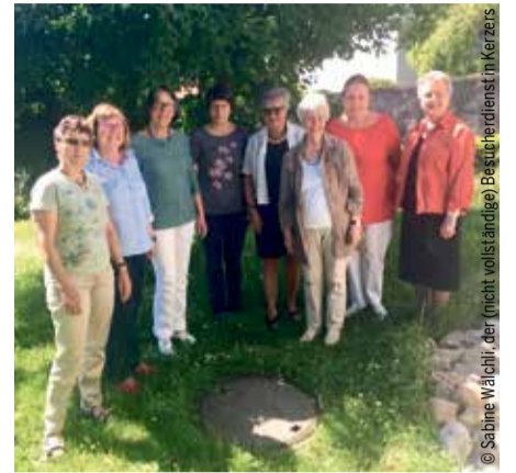
der (nicht vollst. ändige) Besucherdienst in Kerzers