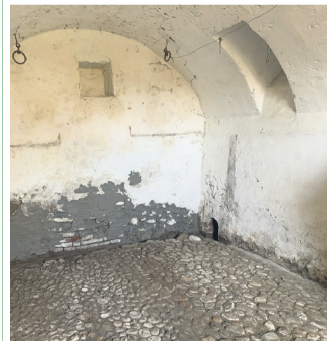
DER KELLERRAUM IM PFARRHAUS ERHÄLT DERZEIT EINEN FRISCHEN FRÜHSOMMER-LOOK UND WIRD MIT TISCH UND BANK GEMÜTLICH EINGERICHTET. SCHON BALD LÄDT DIE KIRCHGEMEINDE ZU EINEM STIMMUNGSVOLLEN ANLASS IM CARNOTZET EIN.