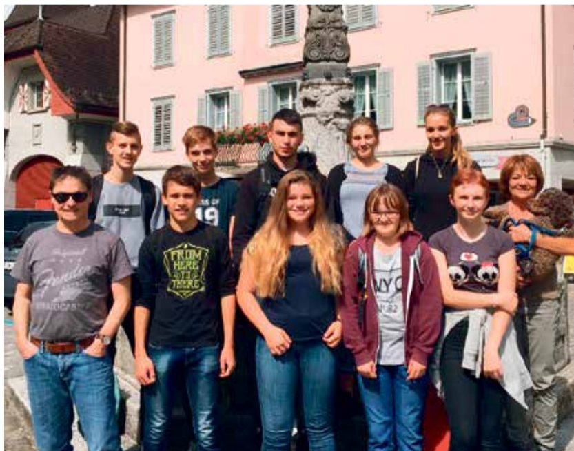
Hier steht die Klasse mit Pfarrer und Katechetin vor dem Bruder Klaus-Brunnen in Sachseln...