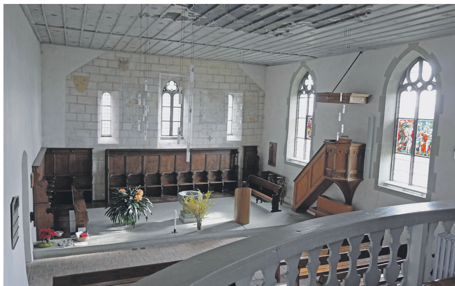
Blicke von der Empore in den Chor der schmucken Kirche, die auf dem Gelände es ehemaligen Klosters steht.

1485 wurde das Kloster aufgehoben und in das Vinzenzstift in Bern inkorporiert. Die heutige Kirche stammt grösstenteils aus dem Jahr 1574, als man die Klosterkirche durch einen Neubau ersetzte: «unter weitgehender Verwendung der Süd- und Ostmauern», wie der «Kunstführer durch die Schweiz» informiert. Der Klosterbau überlebte bis 1640 und diente zuletzt als Pfarrhaus. pk