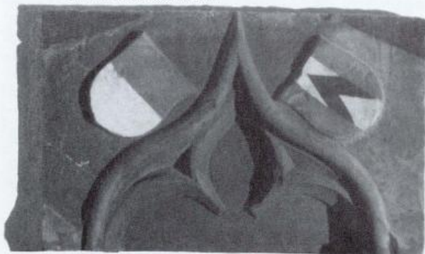
Die Familienwappen der Bubenberg(?) und Erlach.

nördlichen Ostfensters zwischen den barocken und den gotischen Chorstühlen befunden hat. Da diese 1821 zusammengeschoben werden mussten, um der erwähnten Treppe Platz zu machen, wurde damals eine neue Nische gemacht, indem die Sakramentsnische vor allem nach unten vergrößert wurde. Dies erklärt auch den «Schutt», von dem oben die Rede ist. 1921 wurde die Treppe zur Empore hinter die Chorstühle verlegt und wiederum musste der Archivschrank weichen. Die Schranktüre wurde beim Turm