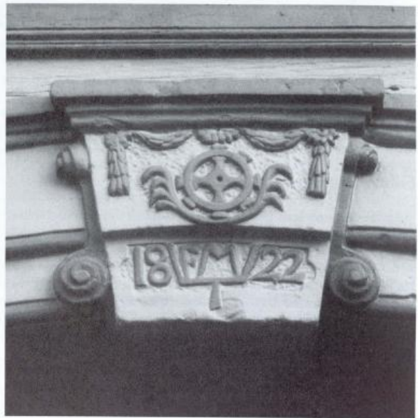
Noch heute deuten Wappen von Friedrich Müller und Jahrzahl auf das Umbaujahr des «Bären» hin.

für die neu angelegten Archive verwendet. Sie unterscheidet sich noch heute ganz deutlich von den jüngeren Geschwistern zu ihrer Linken.