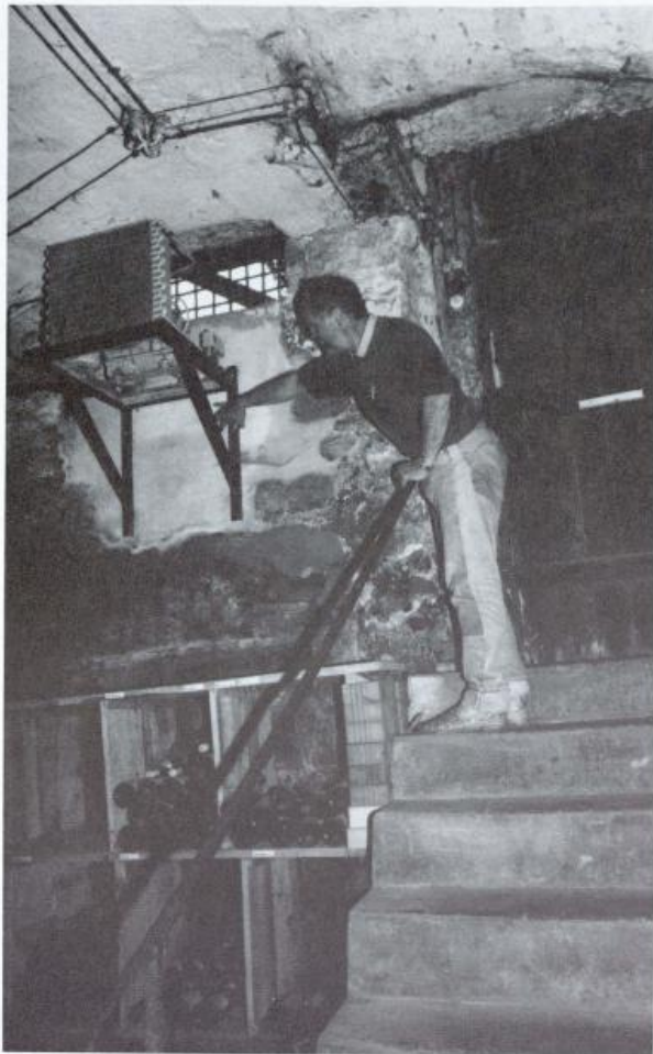
Von 1822 bis 1987 war sie dort als Lichtnische eingebaut.

nördlichen Ostfensters zwischen den barocken und den gotischen Chorstühlen befunden hat. Da diese 1821 zusammengeschoben werden mussten, um der erwähnten Treppe Platz zu machen, wurde damals eine neue Nische gemacht, indem die Sakramentsnische vor allem nach unten vergrößert wurde. Dies erklärt auch den «Schutt», von dem oben die Rede ist. 1921 wurde die Treppe zur Empore hinter die Chorstühle verlegt und wiederum musste der Archivschrank weichen. Die Schranktüre wurde beim Turm